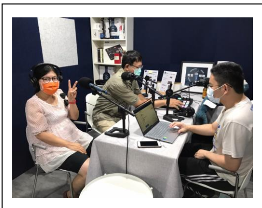
(康復者在專業錄音室錄音)