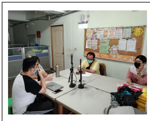
(康復者在討論錄音方向)